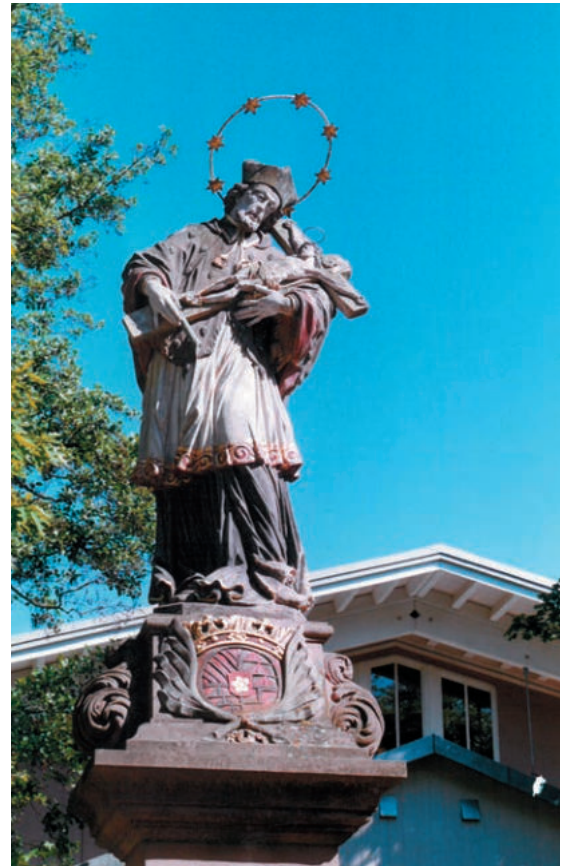
Abb. 20: Nepomukdenkmal.