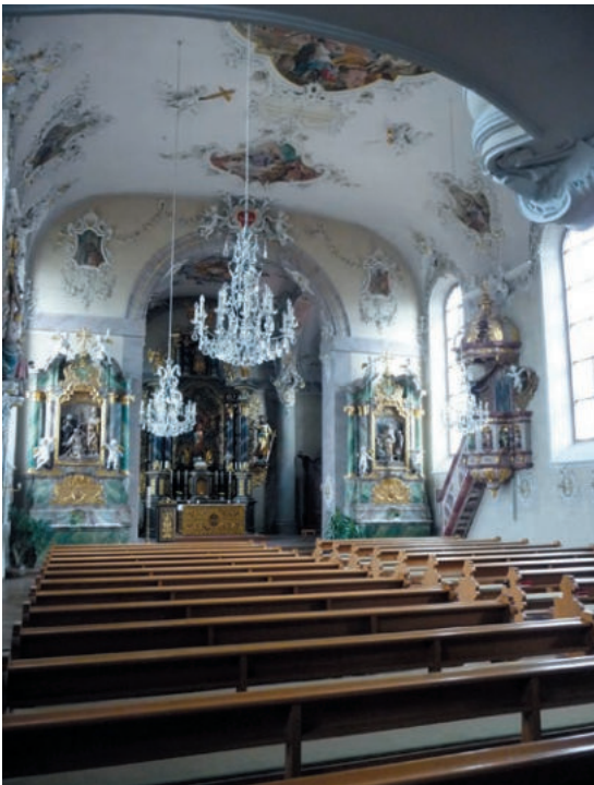
Abb. 10 Die barocke Ausstattung der ehemaligen Johanniterkirche in Villingen, heute in der Kirche von Obereschach.

hinaus können auch historische Kultur-, Denkmal- und Kunstlandschaften Kulturdenkmale im Sinne von als Sachgesamtheiten darstellen. So ist Villingen etwa mit seinen Bauten und Gleisanlagen der Schwarzwaldbahn in eine von Offenburg bis Singen reichende Denkmallandschaft im Sinne einer Sachgesamtheit nach §2 DSchG, bestehend aus der linearen Bahnstrecke, den Ingenieurbauten (wie Unterbau, Stützbauten