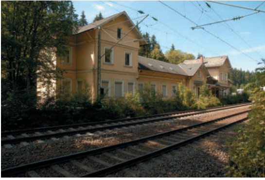
Abb. 9: Bahnhof Kirnach.

hinaus können auch historische Kultur-, Denkmal- und Kunstlandschaften Kulturdenkmale im Sinne von als Sachgesamtheiten darstellen. So ist Villingen etwa mit seinen Bauten und Gleisanlagen der Schwarzwaldbahn in eine von Offenburg bis Singen reichende Denkmallandschaft im Sinne einer Sachgesamtheit nach §2 DSchG, bestehend aus der linearen Bahnstrecke, den Ingenieurbauten (wie Unterbau, Stützbauten