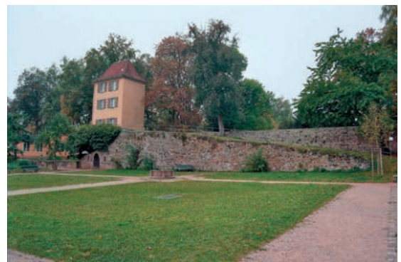
Abb. 12: Geschützrampe am Romäusring mit Elisabethenturm.

Innerhalb der historischen Altstadt sind das Münster und die im 17./18. Jahrhundert stark erneuerten Klöster auch als Einzeldenkmale geschützt. Ebenso sind viele Wohnhäuser innerhalb der Gesamtanlage als Einzeldenkmale ausgewiesen. Sie reichen in ihrer Bausubstanz zum Teil bis in das 12. Jahrhundert zurück. Aber sie sind nicht nur wegen dieser mittelalterlichen Substanz Kulturdenkmale, sondern gleichzeitig Zeugnisse für die Entwicklung und Veränderungen des Typus des städtischen Bürgerhauses vom