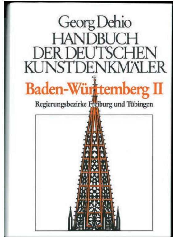
Abb. 5: Titelblatt Dehio Baden-Württemberg.

Georg Dehio war es auch, der auf dem zweiten Tag für Denkmalpflege in Dresden im Jahre 1900 ein Konzept zur Erarbeitung eines „Handbuchs der Deutschen Kunstdenkmäler“ vorstellte, das gegenüber den umfassenden amtlichen Denkmalinventarverzeichnissen als knappes „Nachschlagewerk für die Arbeit am Schreibtisch und zugleich ein bequemes Reisehandbuch sein“ sollte. Die erste 1905 bis 1912 erschienene Auflage kam noch mit fünf handlichen Bänden für das gesamte deutsche Reichsgebiet aus. In den jüngeren Überarbeitungen haben größere Bundesländer inzwischen häufig schon zwei, Bayern sogar fünf Bände. In den Vorworten