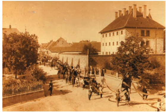
Abb. 6: Festumzug zur 900 Jahrfeier 1899 vor dem Gefängnis (SAVS 1.42.91 Nr. 149).

Das Engagement der Heimatschutzbewegung um die Wende zum 20. Jahrhundert bewirkte, dass neben Kirchen, Burgen und Schlösser auch schon viele städtische Bürgerhäuser und ländliche Bauernhäuser in die Denkmallisten gelangten. Die Gesellschaft erkannte ihre Pflicht, nicht nur die Geschichte der Herrschenden, sondern die Geschichte aller sozialen Schichten denkmalpflegerisch zu würdigen. Max Dvorak entwickelte 1916 in seinem Katechismus der Denkmalpflege den Gedanken, dass der Denkmalschutz nicht allein auf die hervorragenden Denkmale zu begrenzen ist. „Das Geringe bedarf da oft mehr des Schutzes als das Bedeutende“. Seit Mitte des 20. Jahrhunderts begann die Denkmalpflege von rein stilgeschichtlichen Betrachtungen und der Stadtbildpflege durch Fassadendenkmalschutz Abstand zu nehmen. Die historische Aussage eines Fachwerkhauses