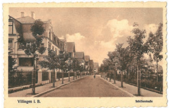
Abb. 14: Schillerstraße im Jahr 1900 (SAVS 5.2.4 Nr. 3640).

Mit Blasius Geiger in Schwenningen sowie Karl Naegele und Theodor Glatz in Villingen gab es um die Wende zum 20. Jahrhundert drei herausragende Architekten, die vom gehobenen Bürgertum gern mit dem Bau ihres Wohnhauses, einer Gaststätte, aber auch von der Stadt mit kommunalen Bauaufgaben (etwa Schulen, Forstamt etc.) betraut wurden. Die nach ihren Plänen errichteten Gebäude sind als Zeitzeugnisse der großbürgerlichen Wohnkultur, die die künstlerische und architektonische Fortentwicklung des Historismus zu den verschiedenen Reformstilen des frühen 20. Jahrhunderts im Allgemeinen, aber auch