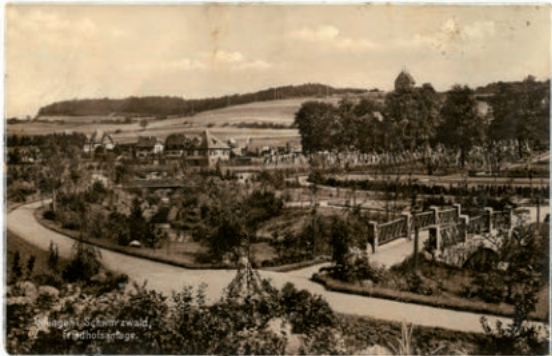
Abb. 13: Friedhofsanlage (SAVS 1.42.91 Nr. 199).

Die schon genannte Friedhofskapelle mit dem romanischen Turm gehört zum Villinger Friedhof. Dieser bildet ein Kulturdenkmal im Sinne einer Sachgesamtheit nach §2 DSchG. Er entwickelte sich aus dem ummauerten Kirchhof der mittelalterlichen Kirche. Der denkmalgeschützte Bereich umfasst den der Friedhofskapelle südlich und westlich vorgelagerten Bereich. Hier lassen sich an Hand historischer Mauern noch Friedhofserweiterungen des späten 19. Jahrhunderts bis 1910 ablesen. Wesentlich für die Denkmaleigenschaft ist jedoch die gartenarchitektonische und gartenkünstlerische Gestaltung des Friedhofsgeländes. Ein wohl gegen 1908 angelegter