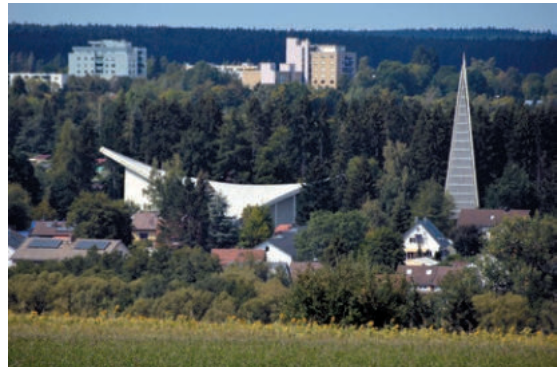
Abb. 2: Konradskirche, 1964–1967.

Um Entwicklungen und Zusammenhänge der Architekturgeschichte verstehbar und handhabbar zu machen, wurden und werden von Architekturhistorikern allgemeine Begriffe sowie Schemata entwickelt und zur Anwendung gebracht, mit deren Hilfe es möglich ist, Bauwerke in verschiedene Baugattungen bzw. Bautypen zu untergliedern. Innerhalb einer Baugattung lassen sich