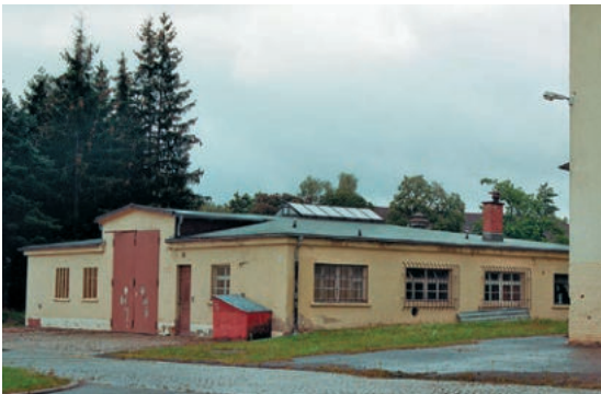
Abb. 16: Pontarlierstraße 1, Waffenmeisterei.

innerhalb ihres jeweiligen Schaffens im Besonderen widerspiegeln. Eine Villingener siedlungs- und ortsgeschichtliche Besonderheit bilden die Gebäude, die als Villengürtel um die zur Grünfläche umgewandelten ehemaligen Wallanlagen vor der Stadtmauer errichtet wurden. Während Naegle in Villingen noch im Krieg die Richthofen-Kaserne (später Lyautey-Kaserne) verwirklichte und in der Zwischenkriegszeit u. a. Mietshäuser für die Villingener Baugenossenschaft sowie Vorstadtvillen in der Schillerstraße entwarf, führte