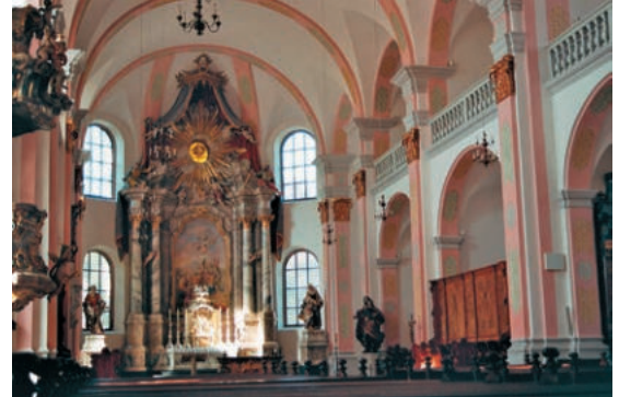
Abb. 11: Benediktinerkirche in Villingen, Schulgasse 19.

und Stützmauern, Dammentwicklung, Brücken, Tunnel, Durchlässe jeglicher Art, Holzrutschen) und den Kunstbauwerke bzw. Hochbauten (wie Stations-, Bahnhofsempfangs- bzw. Aufnahmegebäude an Bahnhöfen bzw. Haltepunkten und -stellen, Bahnbeamtenwohnhäuser, Bahnwärter- bzw. Streckenwärterhäuschen, Bahnbetriebswerk Villingen, Stellwerke, Wachhütten, Güterschuppen, Lagerhäuser und andere Nebengebäude), eingebunden. Die 1864–73 zunächst eingleisig verlegte, bis 1921 zweigleisig vollendete und 1972–77 elektrifizierte Bahnstrecke ist aus wissenschaftlichen, besonders ingenieurbau- und technikgeschichtlichen, verkehrsgeschichtlichen, sozial- und wirtschaftsgeschichtlichen und tourismusgeschichtlichen sowie heimatgeschichtlichen Gründen ein Kulturdenkmal. Weitere über Villingen-Schwenningen hinausgreifende denkmalfähige historische Kontexte wurden bisher zwar noch nicht erkannt und ausgewiesen. Allerdings wäre es durchaus möglich, dass eine (derzeit vom Landesamt für Denkmalpflege sicherlich nicht leistbare) vertiefende Erforschung der Geschichte der Villingener Klöster und ihrer in den historischen Urbaren verzeichneten Lehnshöfe und anderen Besitzungen eines Tages zu