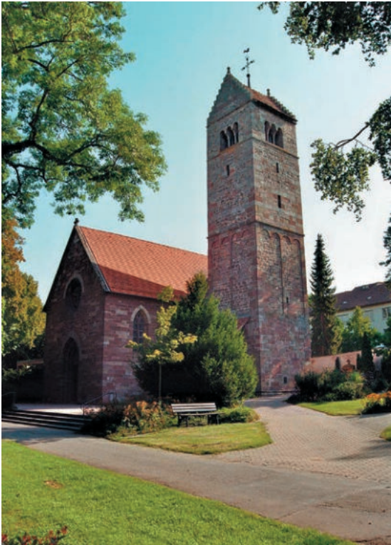
Abb. 11: Friedhofskirche.

Als ältestes erhaltenes Bauwerk Villingens ist der romanische Kirchturm der ansonsten neu-