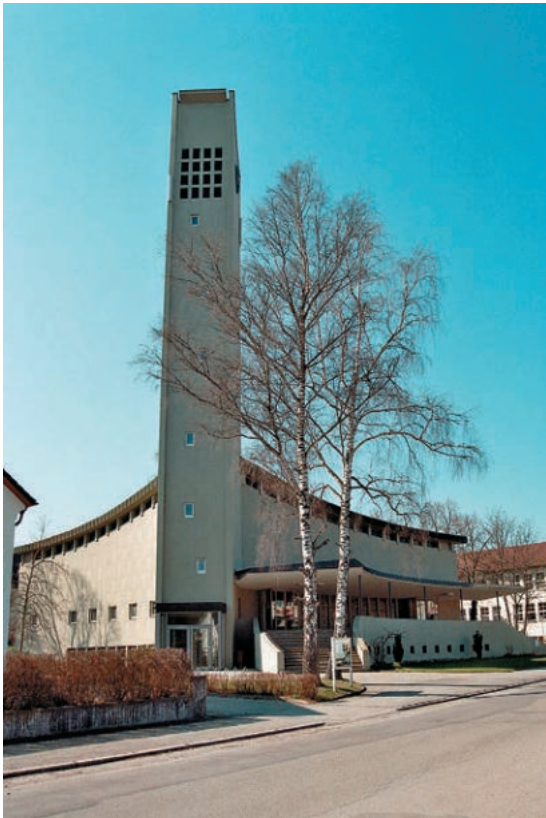
Abb. 19: Evangelische Johanneskirche Schwenningen.

schen die kath. Bruder-Klaus-Kirche (1962/63 nach Entwurf von Erwin Foos, mit Glasfenstern von Romuald Hengster und Wilfrid Perraudin) und die ev. Markuskirche (1961/1962 nach Plänen von Fritz Eberhard) den Hügel, während sich an dessen westlich vorgelagerten Hang die locker als Pavillonschule gruppierten Gebäude der Goldenbühlschule (1961–1964 nach Plänen von Günter Behnisch und Lothar Seidel) schmiegen. Während die Goldenbühlschule als Pavillonschule noch einen in den 1950er Jahren stark vertretenen Schultyp verkörpert, ist das vom Büro Behnisch wenig später in Schwenningen geschaffene Deutenberggymnasium (1962–65) eine Vollmontageschule. Gemeinsam mit der Firma Rostan entwickelte Behnisch Anfang der 1960er Jahre ein flexibel verwendbares Konstruktionssystem vorgefertigter Betonmontageelemente. Durch das Montagebaukastensystem war kein Schultyp vorgegeben, es ermöglichte durch typisierte Bauteile und typisierte Bausysteme den dem jeweiligen