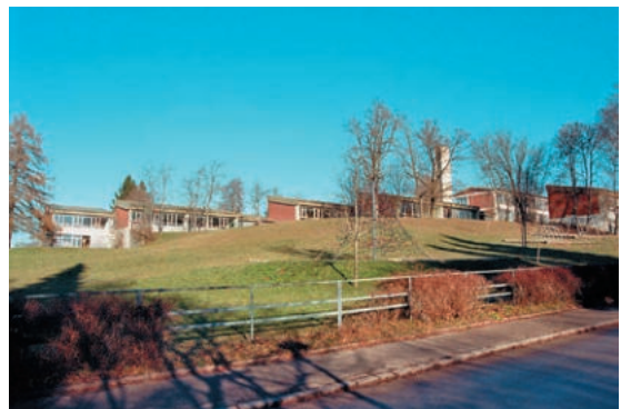
Abb. 3: Goldenbühlschule nach Plänen von Günter Behnisch und Lothar Seidel, 1961–1964.

weitere Spezifika und Muster aus differenzieren, über die sich ein einzelnes Bauwerk in die historische Entwicklung seines Bautyps im Allgemeinen, aber auch in seinen individuellen, eher retardierenden oder innovativen Besonderheiten einordnen lässt. Aus diesen allgemeinen Bedingungen heraus lassen sich allgemeine Bewertungskriterien zur Einschätzung der Bedeutung historischer Zeugnisse ableiten. Aus den Betrachtungsperspektiven der für ein historisches Objekt relevanten Geschichtsdisciplinen ergeben sich die Kriterien, ob dieses einen oder mehrere besondere Aussagewerte besitzt, die für eine Denkmaleigenschaft sprechen. Nach einer abwägenden Gegenüberstellung aller bei Abfassung einer Subsumtion bekannten Argumente, die für oder gegen die im DSchG festgeschriebenen Begründungskriterien für Denkmalwerte sprechen, wird von der Denkmalfachbehörde erkannt, ob das Objekt denkmalfähig und denkmalwürdig ist oder nicht.