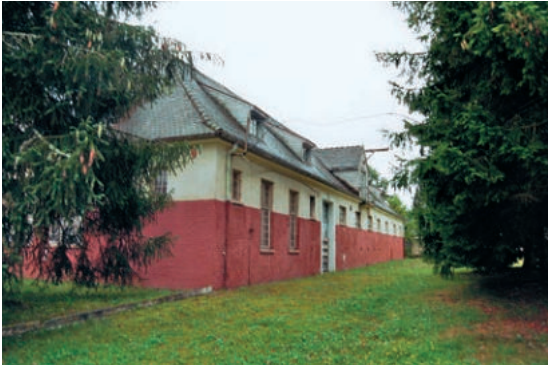
Abb. 15: Pontarlierstraße 1, Krankenstall der Kaserne.

innerhalb ihres jeweiligen Schaffens im Besonderen widerspiegeln. Eine Villingener siedlungs- und ortsgeschichtliche Besonderheit bilden die Gebäude, die als Villengürtel um die zur Grünfläche umgewandelten ehemaligen Wallanlagen vor der Stadtmauer errichtet wurden. Während Naegle in Villingen noch im Krieg die Richthofen-Kaserne (später Lyautey-Kaserne) verwirklichte und in der Zwischenkriegszeit u. a. Mietshäuser für die Villingener Baugenossenschaft sowie Vorstadtvillen in der Schillerstraße entwarf, führte