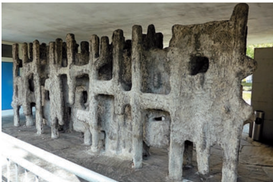
Abb. 21: Räumliche Wand am ehemaligen Finanzamt Schwenninger Straße von Otto Hajek.

Neben hier nicht im Einzelnen benennbaren religiösen Kleindenkmalen wie Wegkreuzen, Bildstöcken, Heiligenstatuen oder Kapellen können auch historische Grenzsteine, Brunnen, Gedenkmale für bedeutende Persönlichkeiten oder an historische Ereignisse etc. Kulturdenkmaleigentumschaft besitzen. Aus künstlerischen