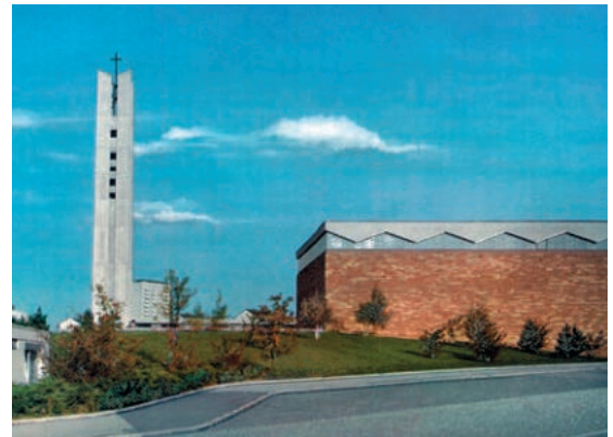
Abb. 17: Markuskirche (SAVS 5.2.4 Nr. 142).

Einen Schwerpunkt architektonisch herausragender Qualität der 1950er und 1960er Jahre bildet der Kirchen- und Schulbau. Sehr eindrucksvoll als Stadtkrone einer Ende der 1950er/Anfang der 1960er Jahre neu entstandenen Siedlung sind beide Bauaufgaben auf dem Goldenbühl vereinigt. Auf einer gärtnerisch gestalteten Freifläche, jeweils als Gemeindezentrum angelegt, beherr-