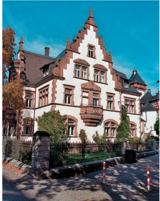
Abb. 8: Gebäude Mönchweilerstraße 6.

gen nachzuzeichnen und einzuordnen, deren Kenntnis, will man historische Zeugnisse unserer Geschichte nicht zerstören oder überbauen, für weitere Planungen unabdingbar sind.“ (Volker Osteneck 1987).