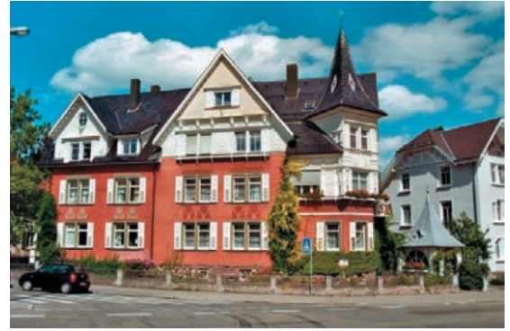
Abb. 1: Kirmacher Straße 2.

Die Verfasser des am 1. Januar 1972 in Kraft getretenen DSchG widerstanden der Versuchung, alle damals bekannten, möglichen Geschichtswissenschaften und Formen tradierter Geschichtszeugnisse auflisten zu wollen. In ihrer juristischen Weisheit wählten sie bewusst den knappen Begriff der „wissenschaftlichen Gründe“. Damit sind nicht nur die bis zum Zeitpunkt der Abfassung des Gesetzes bekannt gewordenen denkmalwerten Zeugnisse der Kulturgeschichte erfasst. Der Gesetzestext lässt offen, welche kulturgeschichtlich wertvollen Zeugnisse zukünftige Epochen hervorbringen werden. Er lässt auch offen, welche Forschungswege die Geschichtswissenschaft in Zukunft ausbilden wird und welche Fragen sie an die Geschichte stellen werden. Solange es Menschen gibt, produzieren diese immer neue